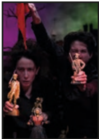
« Les Misérables »