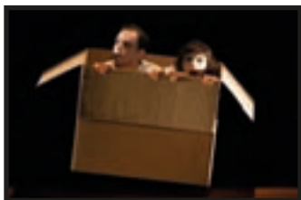
Le Shlemil Théâtre